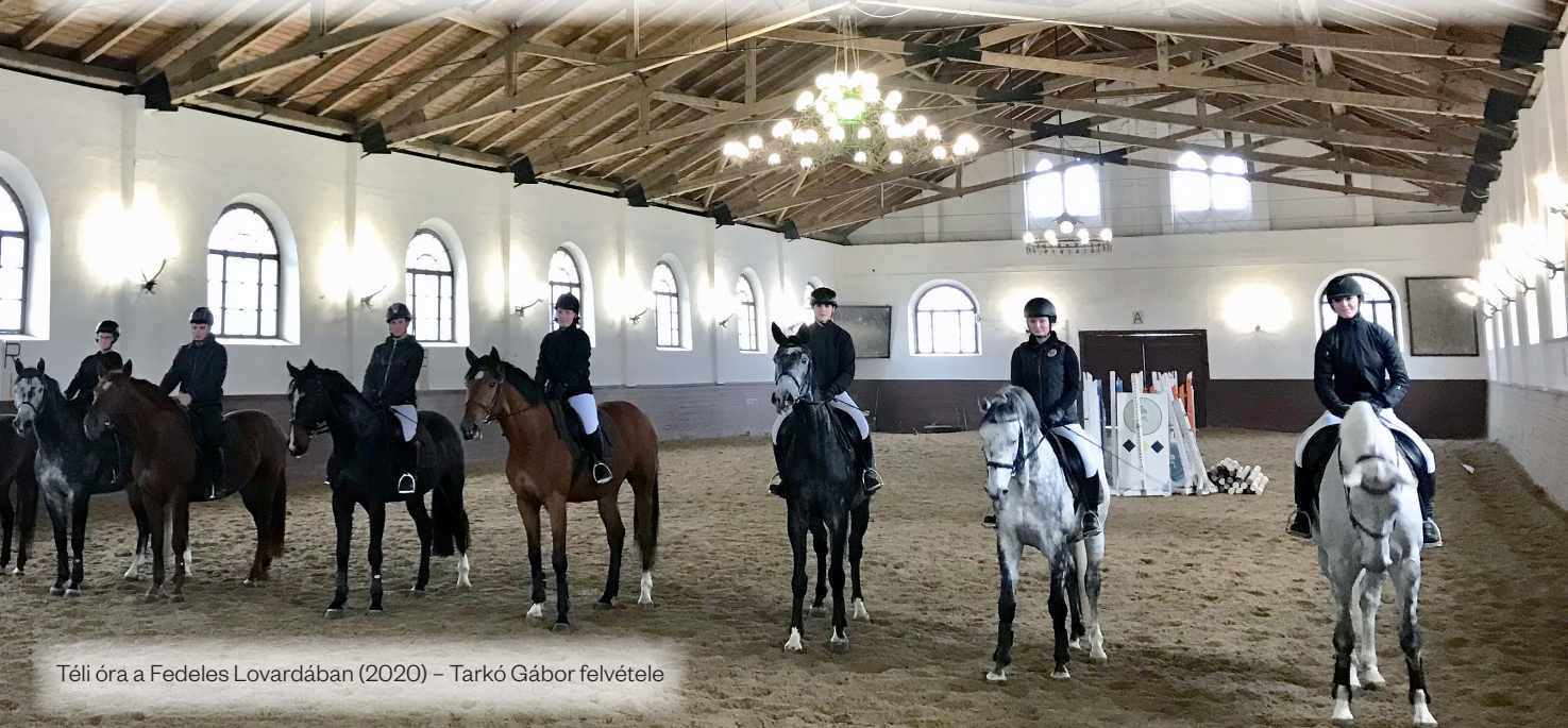
Téli óra a Fedeles Lovardában (2020)

Megújult formában kínáljuk országos beiskolázású lovas képzésünket leendő diákjaik figyelmébe. A Gazda szakképző iskolai képzés lovasz és állattenyésztő szakmairánnyal folyik az iskolában. A Ménesbirtok Lótenyésztési Osztályának folyamatosan szüksége van az iskola által kibocsájtott szakemberekre, a lóállomány jelenleg 279 egyedből áll. Tanulóink a 2018/2019-es tanévben a Lovász Szakma Kiváló Tanulója Versenyen II. és IV. helyezést értek el – a legrangosabb országos szakmai versenyt 2019 áprilisában Mezőhegyesen rendeztük. 2018-ban és 2019-ben is a „Magyarország az én hazám” országos közismereti vetélkedőt az iskola háromfős Lovász csapata nyerte meg.