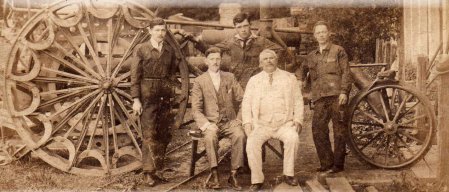
Fowler-féle gőzgép és géplakatosok a gépműhelynél (1923)

A Mezőhegyesi Technikum, Szakképző Iskola és Kollégium többcélú szakképző intézmény, közel 110 éves múltra tekint vissza. A mezőhegyesi szakképzést 1911-ben a világhírű Ménesbirtok munkaerőigénye hívta életre, s az iskola jelenlegi fenntartója is a Nemzeti Ménesbirtok és Tangazdaság Zártkörűen Működő Részvénytársaság. Az iskola jelmondata kifejezi célkitűzését a mezőgazdasági szakképzés megújítására: De praeteritis gloriosis in futura digna! (Dicső múltból méltó jövőbe!) A több mint két évszázados tradícióra épülő lovas képzés mellett a mezőgépezetek képzésének vannak jelentős helyi hagyományai. 1948-ban itt indult hazánkban elsőként traktoros iskola, az 1961/1962-es tanévtől a mezőhegyesi szakképzés fő profílja az országos beiskolázású mezőgazdasági gépszerelő szakma képzése lett.